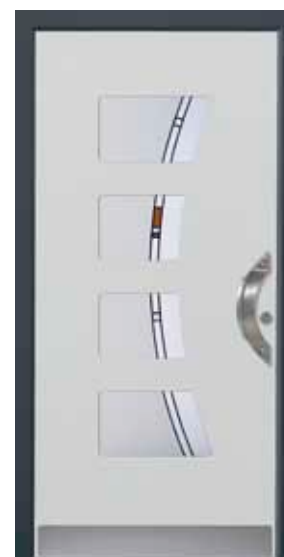
PL-L0B (M735), Motivglas MSAL, Griff TEG12 – KR17, Rahmen HM716, Edelstahlsockel