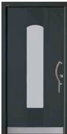
PK-C1B (M716), Glas Satinato weiß, Griff TEG14 – KR17, Rahmen HM716, Edelstahldesignsockel