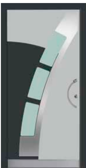
PL-J3B (M735, M716, Edelstahl), Glas Satinato grün, Griff TEG10 – KR17, Rahmen HM716, Edelstahldesignsockel