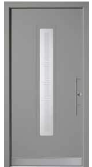
PL-F1B (M704), Motivglas D72, Griff TEG15 – KR17, Rahmen HM704, Edelstahl-designsockel