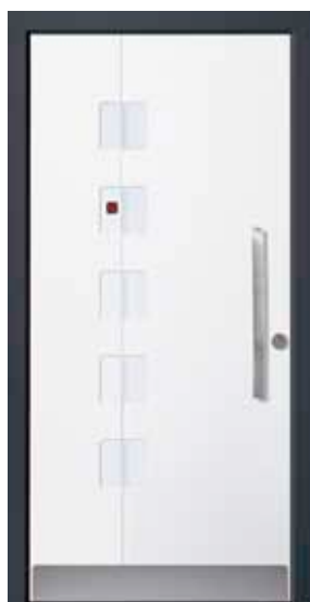
PL-S1B (M916), Motivglas MUCL, Griff MGSE6 – KR17, Rahmen HM716, Edelstahlsockel