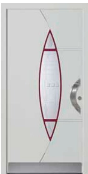
PD-G1B (M735, M304), Motivglas MDNL, Griff TEG12 – KR17, Rahmen HM735, Edelstahlsockel