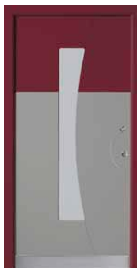
PL-A1B (M704, M304), Glas Satinato weiß, Griff TEG10 – KR17, Rahmen HM304, Edelstahldesignsockel