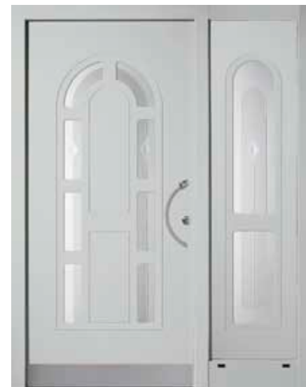
PK-D4B + D1S (M735), Motivglas D06 + D05, Griff TEG10 – KR17, Rahmen HM735, Edelstahlsockel