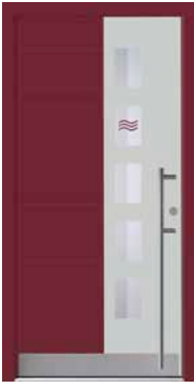
PD-E1B (M735, M304), Motivglas D11 (P14), Griff EGS06 – KR17, Rahmen HM304, Edelstahlsockel