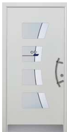
PL-L0B (M735), Motivglas MSBL, Griff HS30 – KR17, Rahmen HM735, Edelstahlsockel