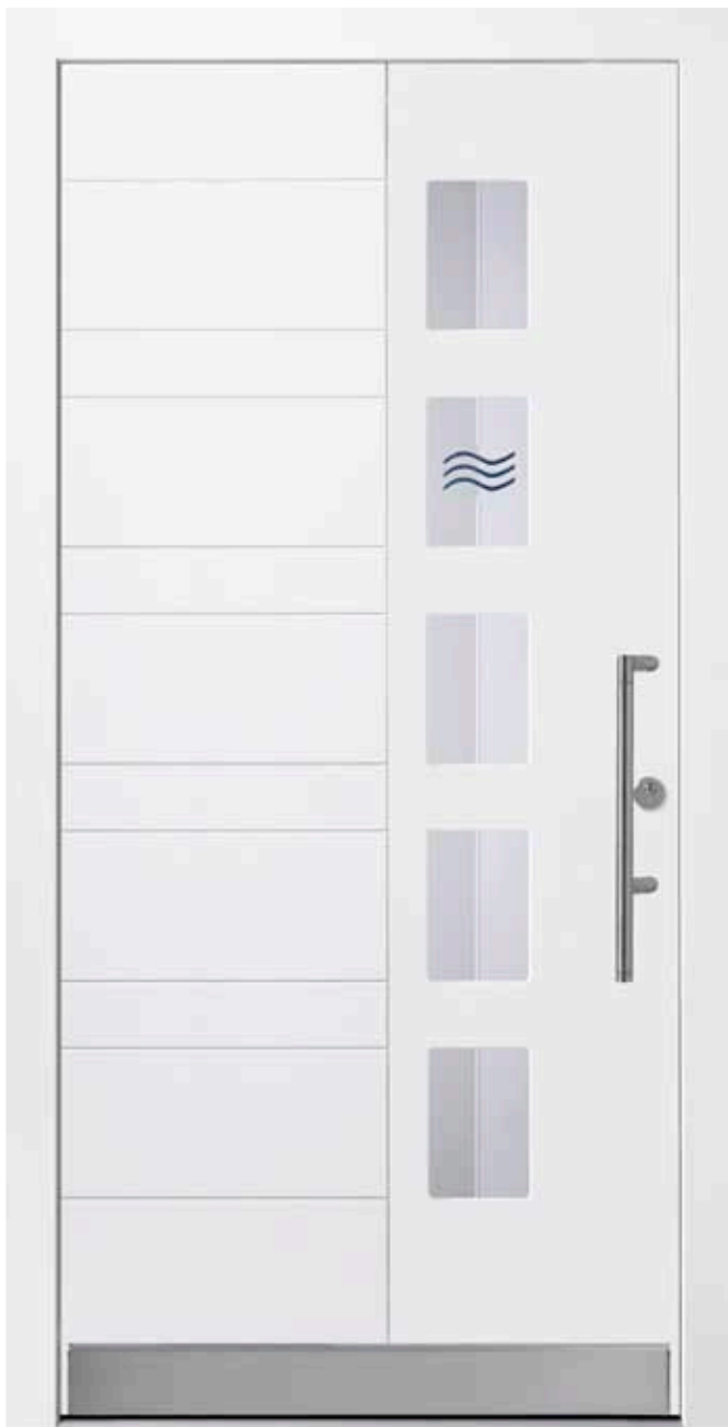
PD-E1B (M916), Motivglas D11 (P26), Griff TEG15 – KR17, Rahmen M916, Edelstahldesignsockel