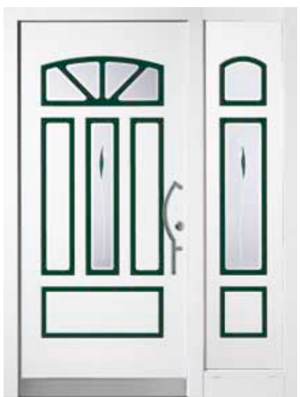
PK-A2B + A2S (M916, M605), Motivglas D36 + D37 (P38), Griff TEG14 – KR17, Rahmen M916, Edelstahl-designsockel