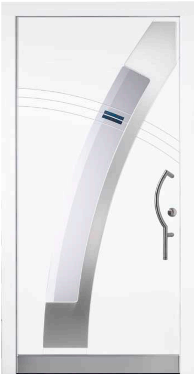
PL-J1B (M916, Edelstahl), Motivglas D78 (P26), Griff TEG14 – KR17, Rahmen M916, Edelstahldesignsockel