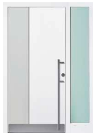
PL-V0B (M916, M735), Seitenteilglas Satinato grün, Griff EGS06 – KR17, Rahmen M916, Edelstahlsockel