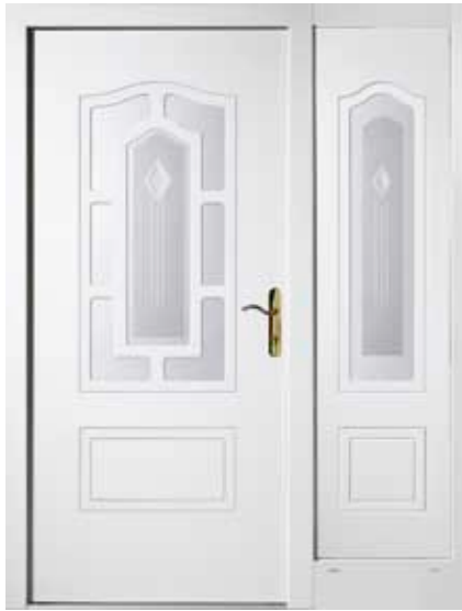
PK-B1B + B1S (M916), Motivglas D43 + D44, Griff VSD15, Rahmen M916