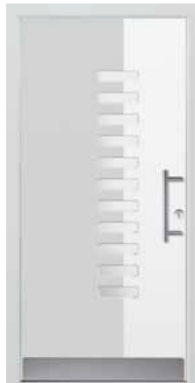
PD-B1B (M916, M735), Glas Satinato weiß, Griff HS10 – KR17, Rahmen HM735, Edelstahlsockel