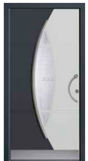
PD-K1B (M716, M735), Motivglas MDNL, Griff TEG10 – KR17, Zierstange, Rahmen HM716, Edelstahlsockel