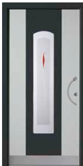
PK-C1B (M716, M735), Motivglas D31 (P07), Griff TEG10 – KR17, Rahmen HM716, Edelstahlsockel