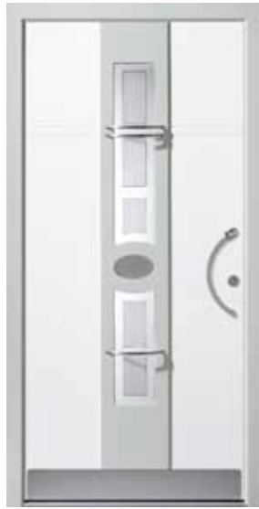
PD-H1B (M916, M735), Motivglas MDP, Griff TEG10 – KR17, Zierspangen, Rahmen HM735, Edelstahlsockel