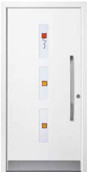
PL-K0B (M916), Motivglas MSEL, Griff MGSE8 – KR17, Rahmen M916, Edelstahlsockel