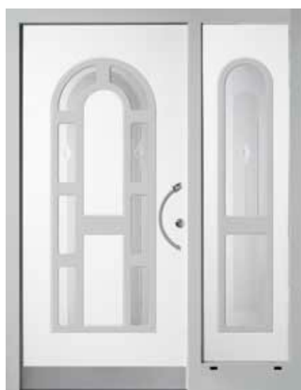
PK-D4B + D1S (M916, M735), Motivglas D06 + D05, Griff TEG10 – KR17, Rahmen HM735, Edelstahlsockel