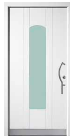
PK-C1B (M916), Glas Satinato grün, Griff TEG14 – KR17, Rahmen M916, Edelstahldesignsockel