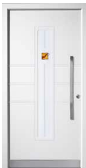
PL-F4B (M916), Motivglas MUAL, Griff MGSE8 – KR17, Rahmen M916, Edelstahl-designsockel