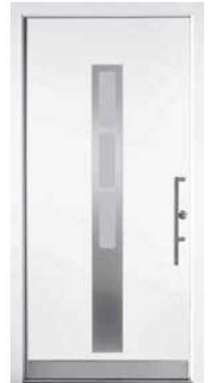
PL-G1B (M916, Edelstahl), Glas Satinato weiß, Griff TEG15 – KR17, Rahmen M916, Edelstahl-design-sockel