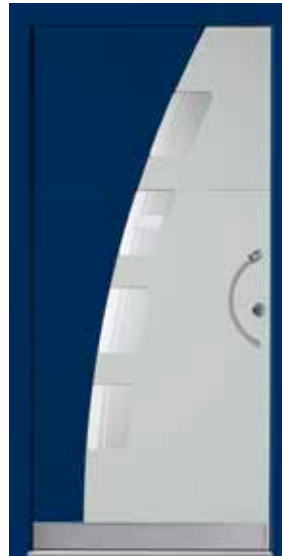
PL-C1B (M735, 5013M), Motivglas D75, Griff TEG10 – KR17, Rahmen 5013M, Edelstahl-designsockel