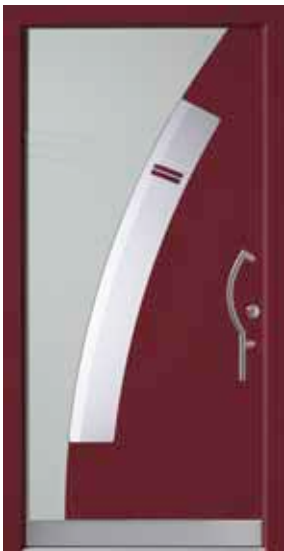
PL-J1B (M304, M735), Motivglas D78 (P14), Griff TEG14 – KR17, Rahmen HM304, Edelstahldesignsockel