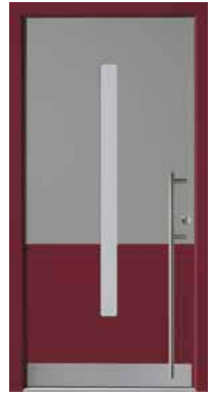
PL-D1B (M704, M304), Glas Satinato weiß, Griff EGS06 – KR17, Rahmen HM304, Edelstahlsockel