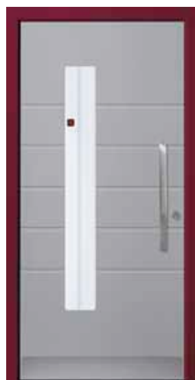
PL-P5B (M704), Motivglas MUCL, Griff MGSE6 – KR17, Rahmen HM304, Edelstahlsockel