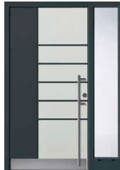
PL-T0B (M735, M716), Seitenteilglas Satinato weiß, Griff EGS06 – KR17, Rahmen HM716, Edelstahlsockel