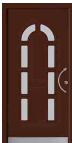
PK-D4B (M817), Glas Satinato weiß, Griff TEG10 – KR17, Rahmen HM817, Edelstahl-designsockel