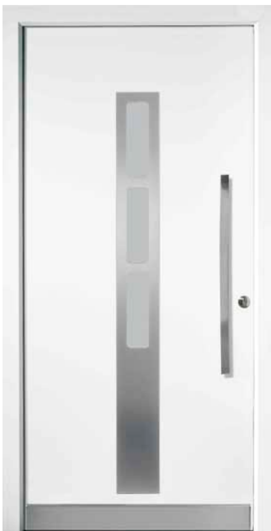
PL-G1B (M916, Edelstahl), Glas Satinato weiß, Griff MGSE10 – KR17, Rahmen M916, Edelstahldesignsockel