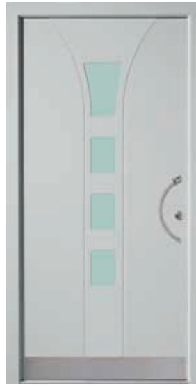
PL-H2B (M735), Glas Satinato grün, Griff TEG10 – KR17, Rahmen HM735, Edelstahlsockel