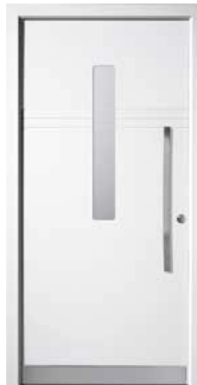
PL-E1B (M916), Motivglas D73, Griff MGSE8 – KR17, Rahmen M916, Edelstahl-designsockel