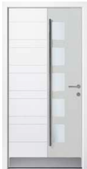
PD-E1B (M916, M735), Glas Satinato weiß, Griff GD15 – GR10, Zierstange, Rahmen M916, Edelstahlsockel