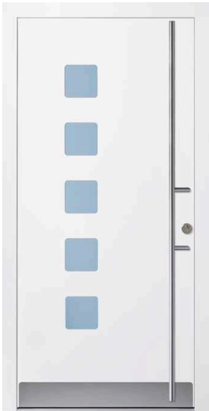
PL-S0B (M916), Glas Satinato blau, Griff EGS08 – KR17, Rahmen M916, Edelstahlsockel