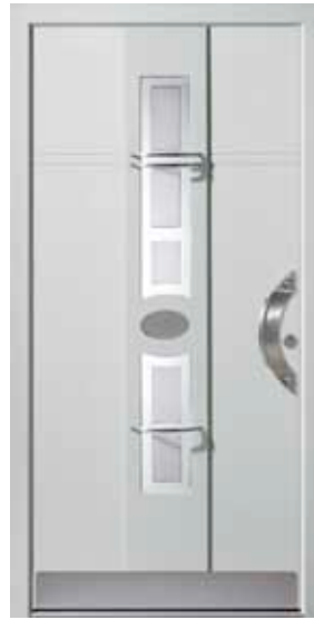
PD-H1B (M735), Motivglas MDP, Griff TEG12 – KR17, Zier-spangen, Rahmen HM735, Edelstahlsockel