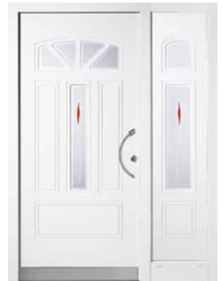
PK-A2B + A2S (M916), Motivglas D36 + D37 (P07), Griff TEG10 – KR17, Rahmen M916, Edelstahl- designsockel