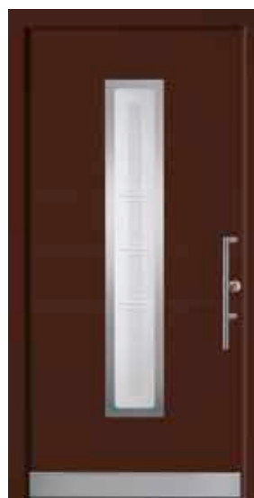
PL-F3B (M817, Edelstahl), Motivglas D72, Griff TEG15 – KR17, Rahmen HM817, Edelstahl-designsockel