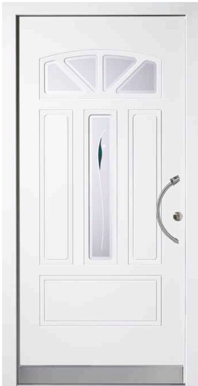
PK-A2B (M916), Motivglas D36 (P38), Griff TEG10 – KR17, Rahmen M916, Edelstahldesignsockel