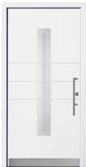
PL-N3B (M916), Motivglas D72, Griff TEG15 – KR17, Rahmen M916, Edelstahlsockel