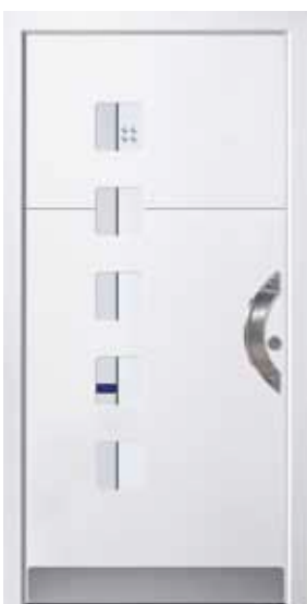
PL-S2B (M916), Motivglas MUFL, Griff TEG12 – KR17, Rahmen M916, Edelstahlsockel