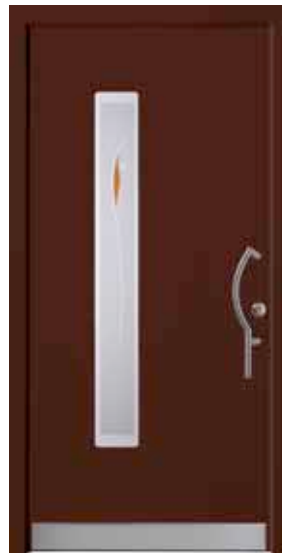
PL-P0B (M817), Motivglas D39 (P05), Griff TEG14 – KR17, Rahmen HM817, Edelstahl-design-sockel