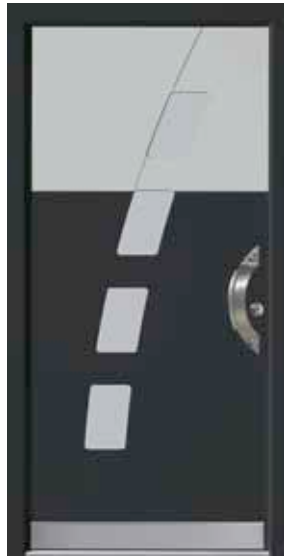
PL-C1B (M716, M735), Glas Satinato weiß, Griff TEG12 – KR17, Rahmen HM716, Edelstahl-designsockel