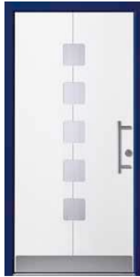
PL-R1B (M916), Motivglas MRI, Griff HS10 – KR17, Rahmen 5013M, Edelstahlsockel