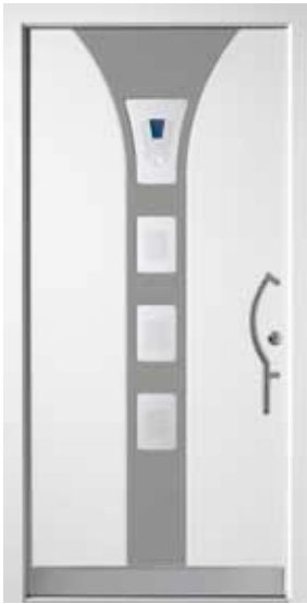
PL-H2B (M916, M704), Motivglas D12 (P26), Griff TEG14 – KR17, Rahmen M916, Edelstahl-design-sockel