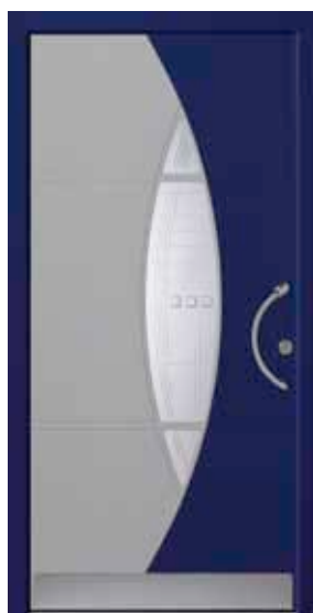
PD-G1B (M704, 5013M), Motivglas MDNL, Griff TEG10 – KR17, Rahmen 5013M, Edelstahlsockel