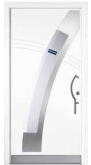
PL-J3B (M916, Edelstahl), Motivglas D78 (P26), Griff TEG14 – KR17, Rahmen M916, Edelstahldesignsockel