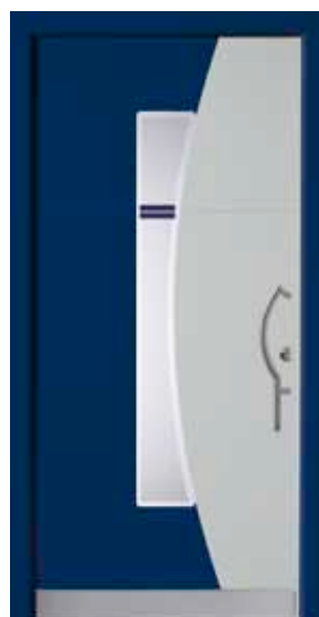
PL-A1B (5013M, M735), Motivglas D77 (P27), Griff TEG14 – KR17, Rahmen 5013M, Edelstahldesignsockel