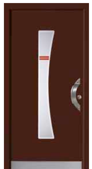
PL-A1B (M817), Motivglas D77 (P07), Griff TEG12 – KR17, Rahmen HM817, Edelstahldesignsockel