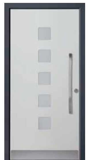
PL-R0B (M735), Glas Satinato weiß, Griff MGSE8 – KR17, Rahmen HM716, Edelstahlsockel