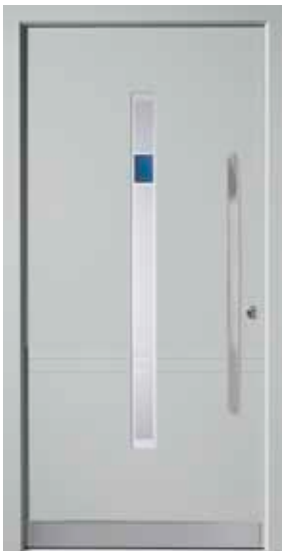
PL-D1B (M735), Motivglas D74 (P26), Griff MGSE10 – KR17, Rahmen HM735, Edelstahl-designsockel