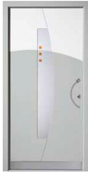
PL-B1B (M735, M916), Motivglas D76 (P05), Griff TEG10 – KR17, Rahmen HM735, Edelstahldesignsockel