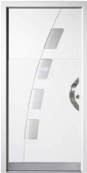
PL-C1B (M916), Motivglas D75, Griff TEG12 – KR17, Rahmen M916, Edelstahl-designsockel