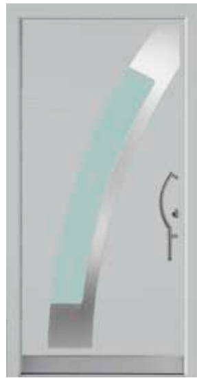
PL-J1B (M735, Edelstahl), Glas Satinato grün, Griff TEG14 – KR17, Rahmen HM735, Edelstahldesignsockel