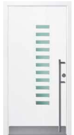
PD-B1B (M916), Glas Satinato grün, Griff EGS06 – KR17, Rahmen M916, Edelstahlsockel