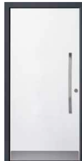
PL-W0B (M916), Griff MGSE8 – KR17, Rahmen HM716, Edelstahlsockel