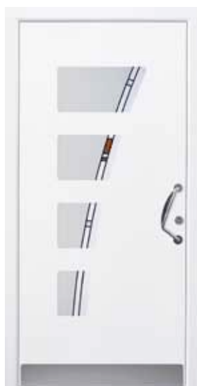
PL-M0B (M916), Motivglas MSCL, Griff VG30 – VR20, Rahmen M916, Edelstahlsockel