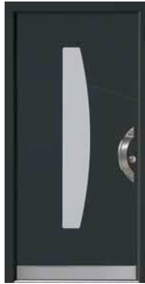
PL-B1B (M716), Glas Satinato weiß, Griff TEG12 – KR17, Rahmen HM716, Edelstahldesignsockel