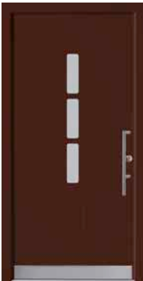
PL-G2B (M817), Glas Satinato weiß, Griff TEG15 – KR17, Rahmen HM817, Edelstahl-design-sockel