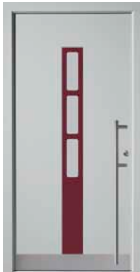
PL-G2B (M735, M304), Glas Satinato weiß, Griff EGS06 – KR17, Rahmen HM735, Edelstahlsockel