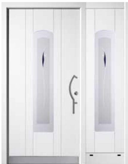
PK-C1B + C1S (M916), Motivglas D31 (P27), Griff TEG14 – KR17, Rahmen M916, Edelstahldesignsockel