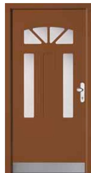
PK-A3B (M803), Cathedral weiß, Griff PSK11, Rahmen HM803, Edelstahlsockel