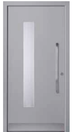
PL-P0B (M704), Motivglas MRI, Griff MGSE8 – KR17, Rahmen HM704, Edelstahlsockel