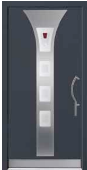
PL-H1B (M716, Edelstahl), Motivglas D12 (P14), Griff TEG14 – KR17, Rahmen HM716, Edelstahl-sockel