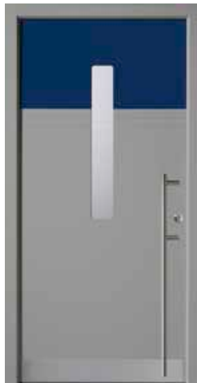
PL-E1B (M704, 5013M), Motivglas D73, Griff EGS06 – KR17, Rahmen HM704, Edelstahlsockel