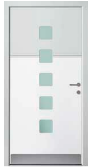
PL-R2B (M916, M735), Glas Satinato grün, Griff GD10 – GR10, Rahmen HM735, Edelstahlsockel