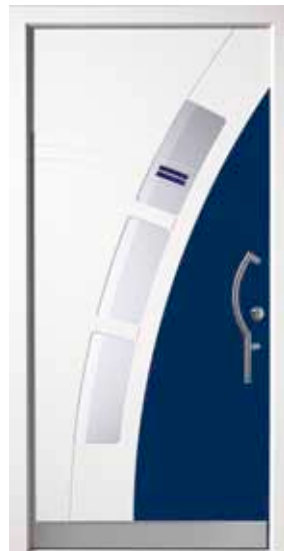
PL-J3B (M916, 5013M), Motivglas D78 (P27), Griff TEG14 – KR17, Rahmen M916, Edelstahldesignsockel