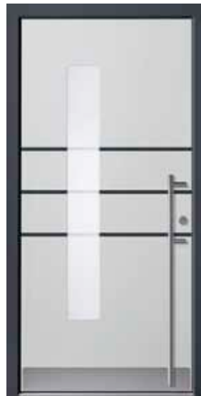
PL-P3B (M735, M716), Motivglas MR3, Griff EGS06 – KR17, Rahmen HM716, Edelstahlsockel