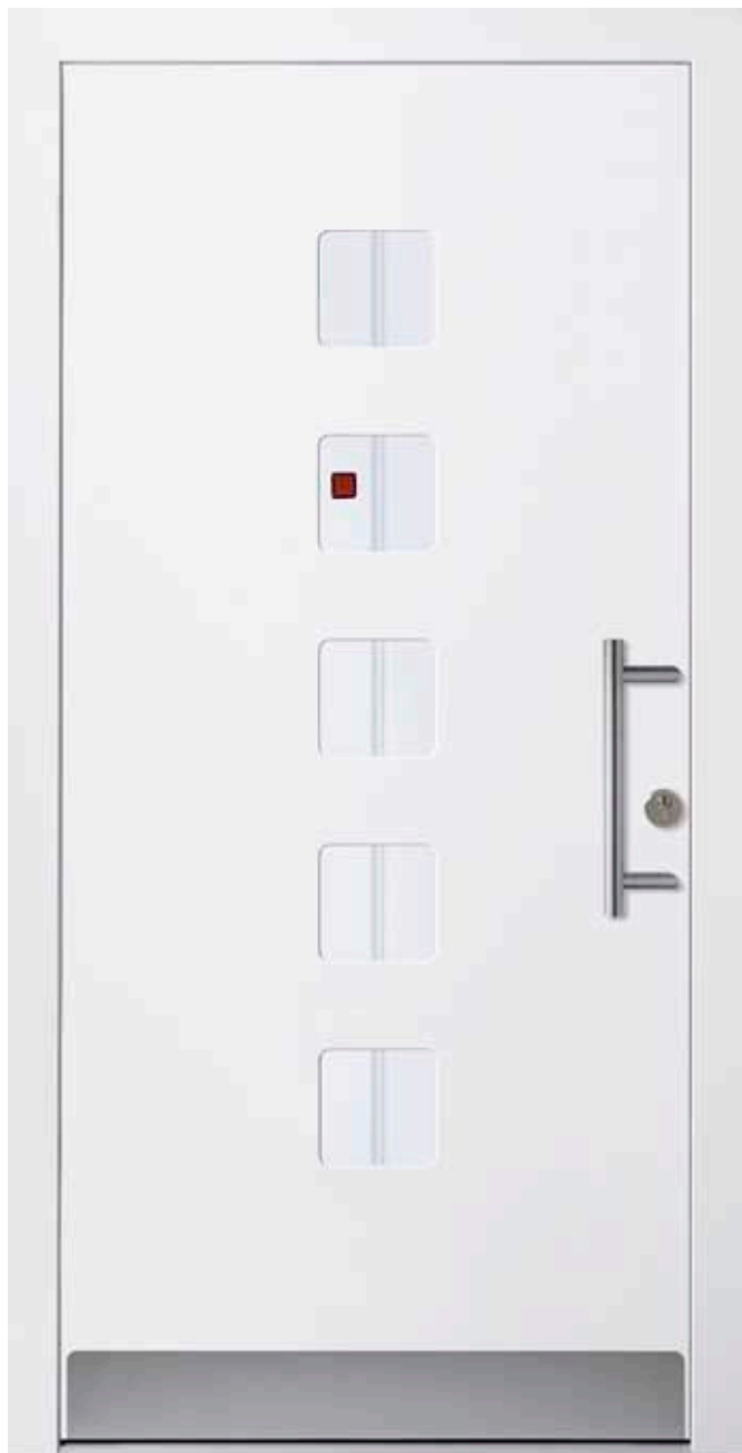
PL-R0B (M916), Motivglas MUCL, Griff HS10 – KR17, Rahmen M916, Edelstahlsockel