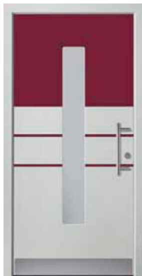
PL-N3B (M735, M304), Glas Satinato weiß, Griff HS10 – KR17, Rahmen HM735, Edelstahlsockel