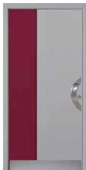
PL-V0B (M704, M304), Griff TEG12 – KR17, Rahmen HM704, Edelstahlsockel