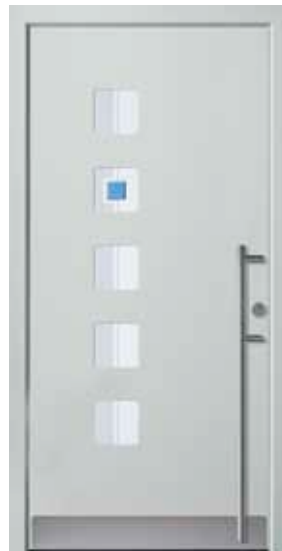
PL-S0B (M735), Motivglas MUBL, Griff EGS06 – KR17, Rahmen HM735, Edelstahlsockel