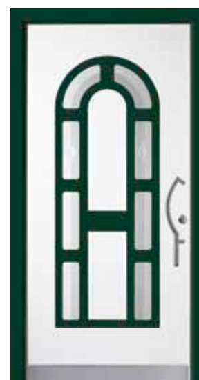
PK-D4B (M916, M605), Motivglas D06, Griff TEG14 – KR17, Rahmen HM605, Edelstahldesignsockel