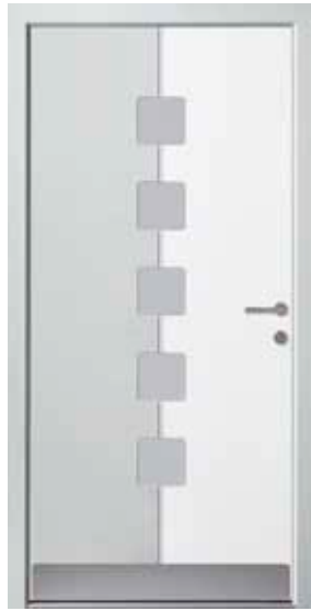
PL-R1B (M916, M735), Glas Satinato weiß, Griff GD15 – GR10, Rahmen HM735, Edelstahlsockel