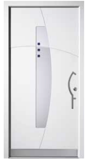
PL-B1B (M916), Motivglas D76 (P27), Griff TEG14 – KR17, Rahmen M916, Edelstahldesignsockel