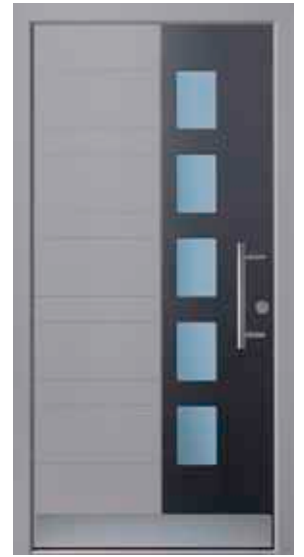
PD-E1B (M704, M716), Glas Satinato blau, Griff HS10 – KR17, Rahmen HM704, Edelstahlsockel