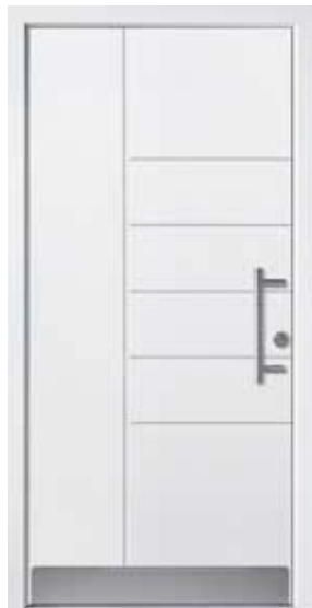
PL-T0B (M916), Griff HS10 – KR17, Rahmen M916, Edelstahlsockel