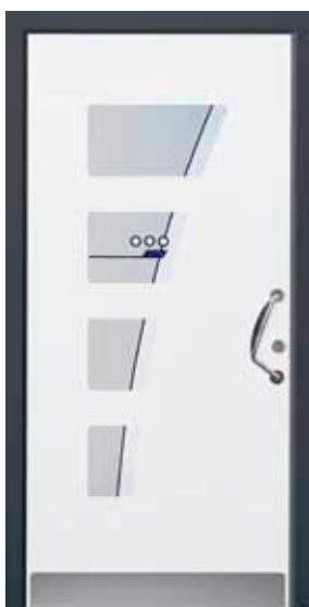
PL-M0B (M916), Motivglas MSDL, Griff VG30 – VR20, Rahmen HM716, Edelstahlsockel