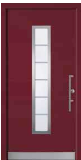
PL-F5B (M304, Edelstahl), Motivglas MR5, Griff TEG15 – KR17, Rahmen HM304, Edelstahl-designsockel