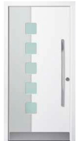
PL-S1B (M916, M735), Glas Satinato grün, Griff MGSE10 – KR17, Rahmen M916, Edelstahl-sockel