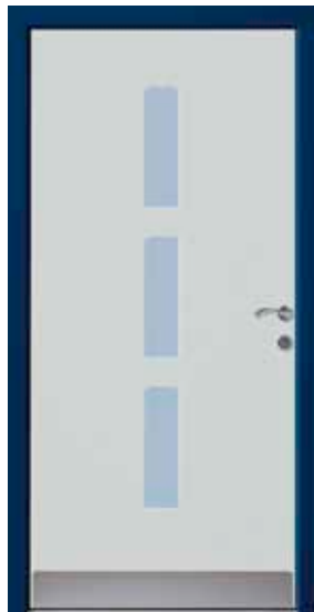
PL-K0B (M735), Glas Satinato blau, Griff VD16 – VR20, Rahmen 5011M, Edelstahlsockel