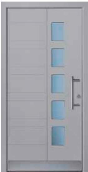
PD-E1B (M704), Glas Satinato blau, Griff HS10 – KR17, Rahmen HM704, Edelstahlsockel