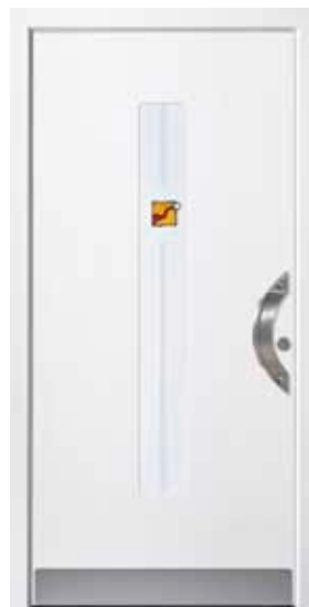
PL-N0B (M916), Motivglas MUAL, Griff TEG12 – KR17, Rahmen M916, Edelstahlsockel