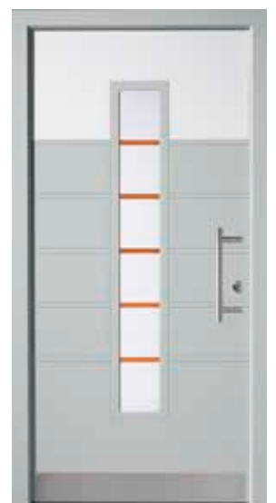
PL-F6B (M735, M916), Motivglas MP5 (P05), Griff HS10 – KR17, Rahmen HM735, Edelstahlsockel