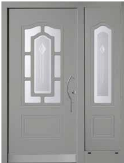
PK-B1B + B1S (M704), Motivglas D43 + D44, Griff TEG14 – KR17, Rahmen HM704, Edelstahl-design- sockel