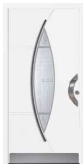
PD-K1B (M916, M704), Motivglas MDNL, Griff TEG12 – KR17, Zierstange, Rahmen M916, Edelstahlsockel