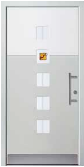
PL-R2B (M735, M916), Motivglas MUAL, Griff HS10 – KR17, Rahmen HM735, Edelstahlsockel